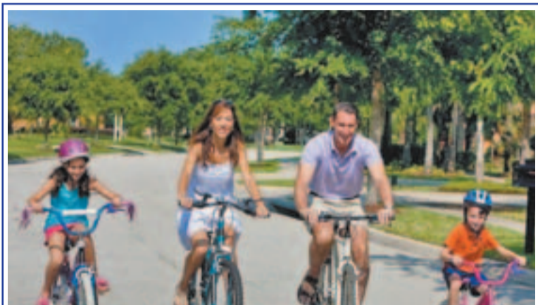
Жители Рязанского района с удовольствием откликаются на приглашения принять участие в массовых окружных велопробегах выходного дня. 6 июля такой велопробег состоялся в лесопарке «Влахернское – Кузьминки» по адресу: ул. Заречье, вл. 7. Организатор мероприятия – государственное бюджетное учреждение «Центр физической культуры и спорта ЮБАО г. Москвы».