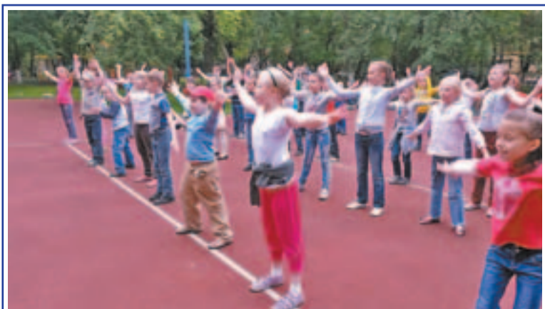
23 июня в оздоровительном лагере «Дружба» средней общеобразовательной школы № 777 прошёл танцевальный флэшмоб, цель которого – привлечь внимание жителей Рязанского района к активному и здоровому образу жизни.

Хочу подчеркнуть, что спорт неразрывно связан с культурой общества, борьбой за здоровый образ жизни, против социальных недугов. Физическое и нравственное здоровье молодого поколения – залог успешного развития России.