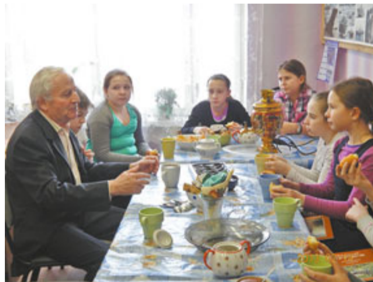
Ветераны с удовольствием общаются с молодёжью, регулярно бывают в образовательных учреждениях. Приятно встретиться с детьми в неофициальной обстановке и ответить на их вопросы.

За счёт средств бюджета города Москвы и в пределах лимита бюджетных ассигнований, выделенных управе Рязанского района по статье «Праздничные и социально-значимые мероприятия для населения» в 2014 году основная часть финансовых средств будут направ-