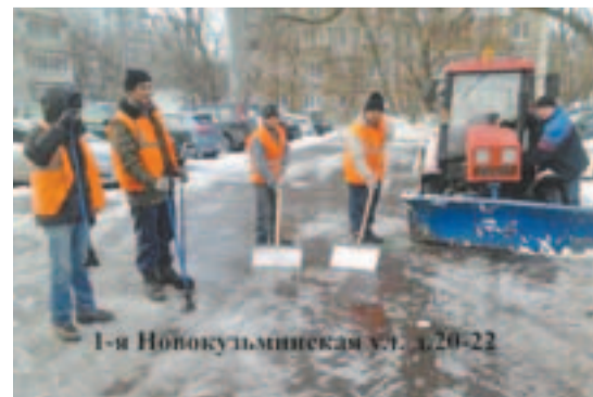
1-я Новокузьминская ул., д. 20-22

В нашем районе на уборку 223 дворов ежедневно заступают 325 дворников, 12 тракторов, дополнительно используются 79 мотоблоков – ручная спецтехника, отбрасывающая снег. В целом укомплектованность дворов снегоборочной техникой составляет 100 процентов. Спасибо всем, кто обеспечивает благополучие людей в этот сложный период времени!