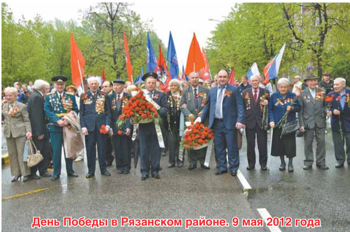
День Победы в Рязанском районе. 9 мая 2012 года

По поручению мэра Москвы Собянина С.С. в настоящее время ведётся работа по формированию Программы комплексного развития ЮВАО на 2012 и последующие годы. Ваши предложения будут рассмотрены и включены в Программу. Предложения направлять: 111024, Москва, ул. Авиамоторная, д. 10, префектура ЮВАО. E-mail: kpr2012@uvao.mos.ru . Портал префектуры ЮВАО: www.uvao.ru