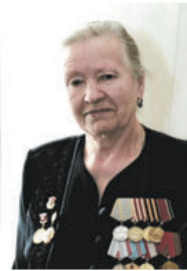
Ветераны Великой Отечественной войны – особая гордость России.

Конкурс проводится по следующим направлениям: продовольственные товары; непродовольственные товары; продукция производственно-технического назначения; услуги для населения. Более подробную информацию о конкурсе можно получить на сайте www.moskachestvo.ru или по телефону: 8(903) 764 – 84-44, 8(495) 988-02-77; e-mail: bestas60@mail.ru